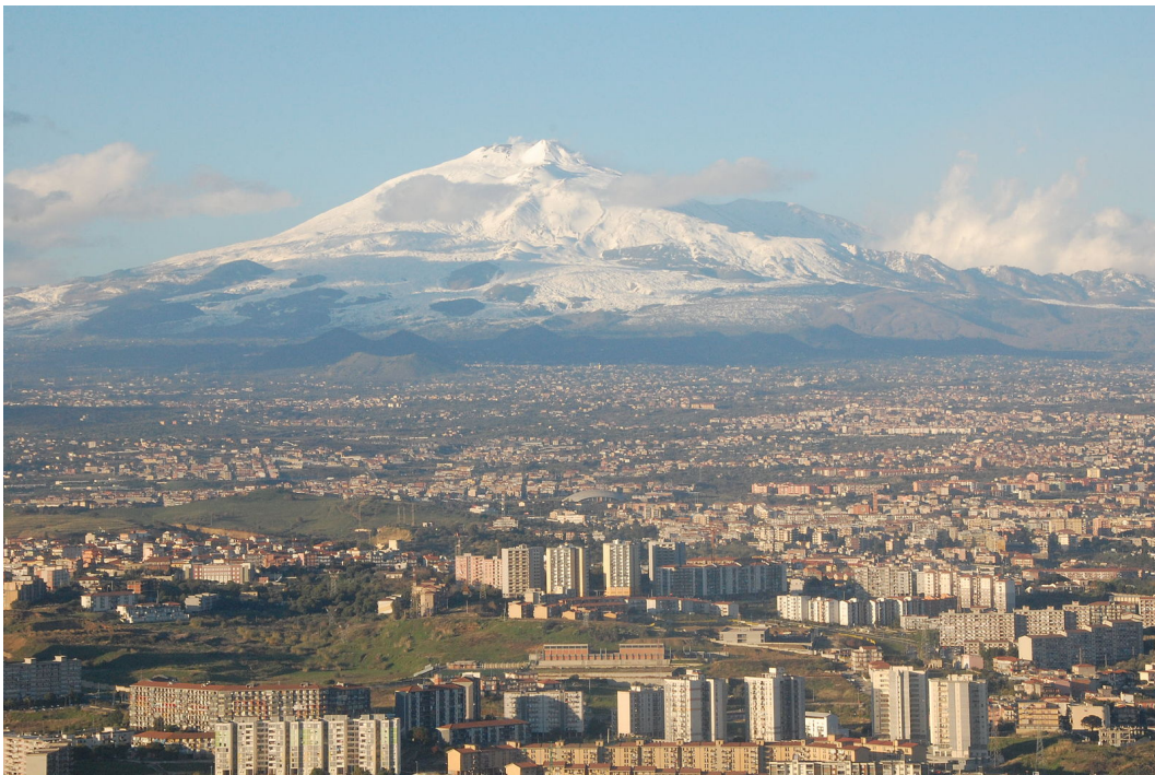
L'Etna et la ville de Catane, en Sicile.

Pour finir, il est intéressant de signaler que la mythologie grecque situe les forges d'Héphaïstos sous l'Etna. Des cyclopes y fabriquent les armes des dieux de l'Olympe tels que le trident de Poséidon ou les foudres de Zeus. Les bruits sourds s'échappant du volcan ne sont autre que le martèlement des outils sur les enclumes. Le rythme de ce travail s'avère finalement donné par la régularité, toute relative, des oscillations du pôle, qui sont elles-mêmes sous le contrôle de la marche de l'océan et de ses vagues, de l'atmosphère et de ses foudres, c'est-à-dire des commanditaires Poséidon et Zeus. Comme quoi, les légendes possèdent toujours un fond de vérité.